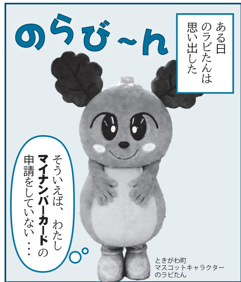
ときがわ町 マスコットキャラクター のラビたん