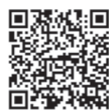
インボイス制度特設サイト