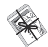
「雑がみ」だけを束ねて ひもでしばって出す