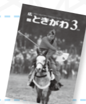
【表紙】萩日吉神社の流鏝馬の「夕まとう」。

人口と世帯(2月1日現在) 総人口 10,566人(-23人) ※0は前月比 1月の動き 出生 3人 死亡 27人 転入等 22人 転出等 21人 男 5,355人(-9人) 女 5,211人(-14人) 世帯数 4,737世帯 (-2世帯) 過去のデータはHPで見ることができます。