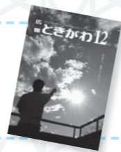
【表紙】若者よ、起業もありだ。

広報ときがわ【第213号】 令和5年11月24日発行 編集・発行 ときがわ町総務課 〒355-0395 埼玉県比企郡ときがわ町大字玉川2490番地 TEL 0493-65-1521(代表) FAX 0493-65-3631 ホームページアドレス http://www.town.tokigawa.lg.jp メールアドレス info@town.tokigawa.lg.jp