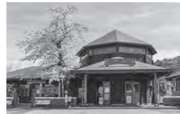
駅舎と桜 (令和4年度)

3月20日(祝)に明覚駅前にて駅前マルシェを開催します。キッチンカーをはじめ、ワークショップや体験型アクティビティなど、様々なイベントを予定しておりますので、ぜひ皆様でお越しください。また、3月下旬から4月中旬頃には、八角形の赤い屋根とログハウス風の駅舎が特徴の明覚駅と、大きな桜の共演が楽しめます。この桜は、 そめいよしの 染井吉野と みくるまがえ 御車返しという品種の2種類で、開花状況は下記のときがわ町観光協会にお問合せください。