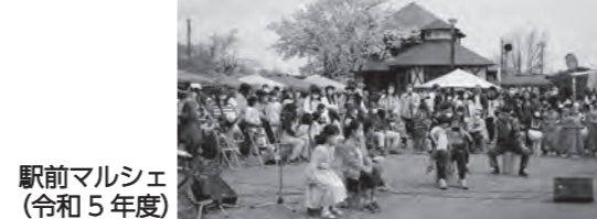
駅前マルシェ (令和5年度)