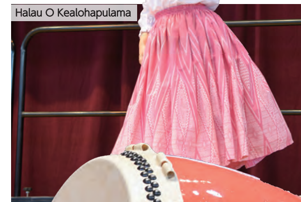
Halau O Kealahapulama