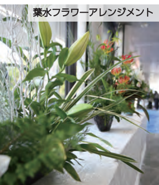
薬水フラワーアレンジメント