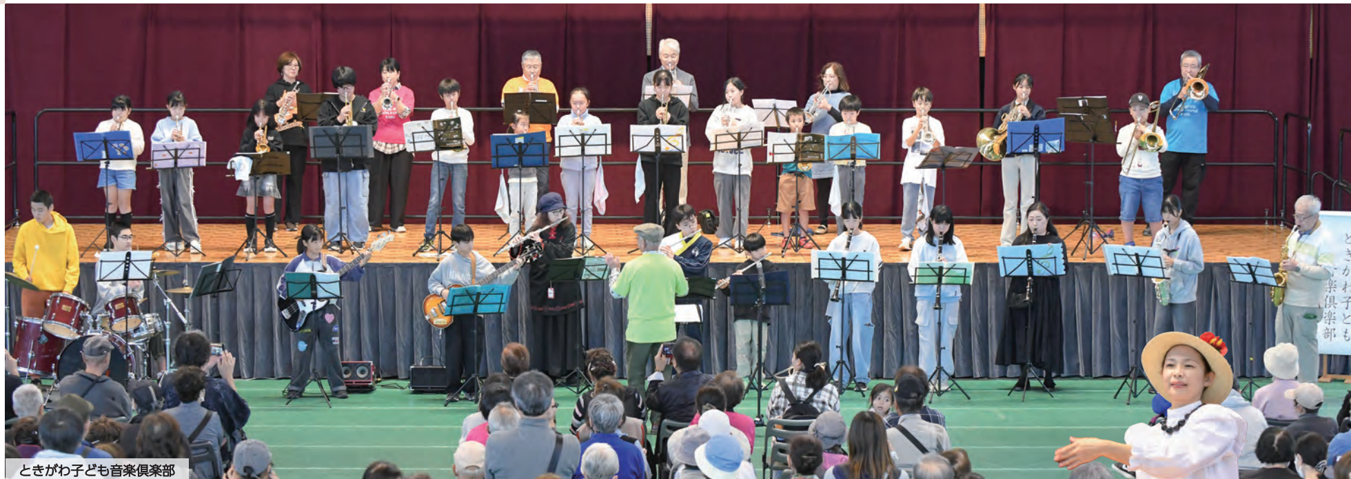
ときがわ子ども音楽倶楽部