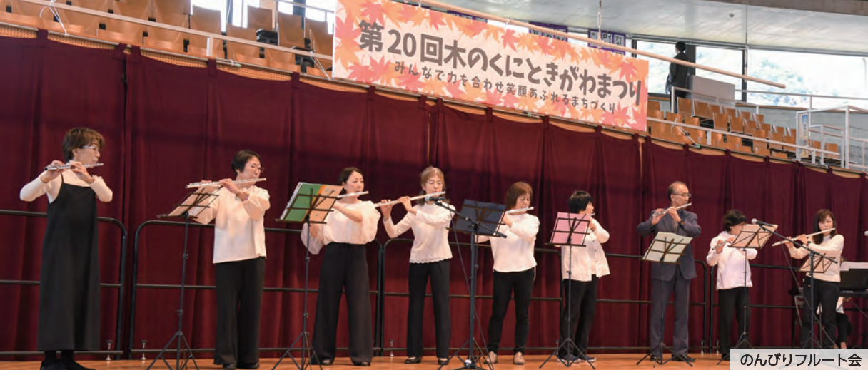
のんびりフルート会