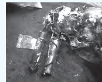
焦げたモバイルバッテリー

町の「資源プラスチック」の処理施設でリチウムイオン電池が原因とみられる発煙が発生しました。「資源プラスチック」や「可燃ごみ」へのリチウムイオン電池の混入は絶対にしないでください。