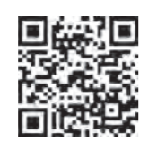
子育て応援きっぷ予約

※令和7年度に使用している二次元コードは、令和8年4月1日より使用できなくなりますので、ご注意ください。