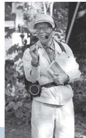
写真・文 / 小林一公さん (大子本郷)

「タチイヌノフグリ」は「こまのはぐさ」科のユーラシア大陸原産の1〜2年生の植物で、明治の初め頃、日本に渡来して、帰化植物となり、今は全国に広がり繁殖しています。形態は、茎は直立して高さ10〜30cm余になり、葉は対生して、大部分は葉柄がなく、葉の縁には数対の低い鋸歯があり、表裏とも短毛によって覆われています。葉は根元から上に行くに従って小さくなり、互生するようになり、花の包葉に変わるようです。包葉になるとより幅が狭くなり、片側に1〜3個の鋸歯を持つようになり、それぞれ一つの花を抱くようになります。図鑑によると、花の時期は毎年3〜6月とありますが、この頃のように異常気象の年には2月頃からの開花も見られるようです。花の大きさは径4mm余で、青紫色をしています。花後には、縁に腺毛のある扁平な実になります。 名前は、生態や特に実の形が、同じ仲間の「オオイヌノフグリ」などに似ていること、草の形状が直立していることから