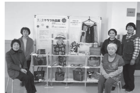
共催事業として手芸作品の展示をしてくださった 大人女(おとめ)クラブの皆さん

センターでは、多世代間交流ホールの一角を、生きがいづくりや健康増進活動をしている団体等の作品や活動の発表の場として無料で提供しており、作品等の展示に協力をしてくださる団体や個人を募集しています。 ◆ 対象団体等 ①町の事業や施策に関連して活動している団体(文化団体、公民館活動、生涯学習、高齢者サロン、子育てサークル、保健センター事業関連団体、趣味の会等) ②町内で生きがいづくりや健康づくりのために活動しているグループや個人(仲良しグループ、個人) ◆ 展示スペース 1階多世代間交流ホール内。幅300cm×奥行100cm×高さ250cmを基本とします。 ◆ 展示期間 15日以内 ◆ 展示方法 陳列ケースはありません。オープン展示となります。 ◆ 展示用資材 展示用パネル、フック、テーブル等を貸し出しします。