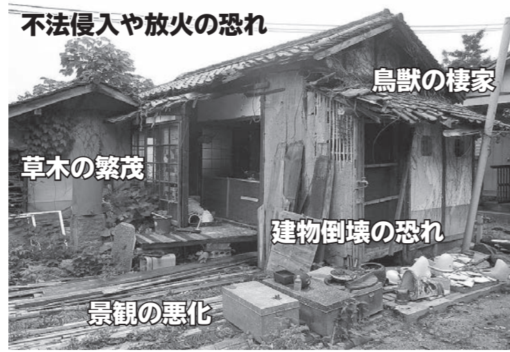
家は使われなくなると、途端に傷みが早くなります！