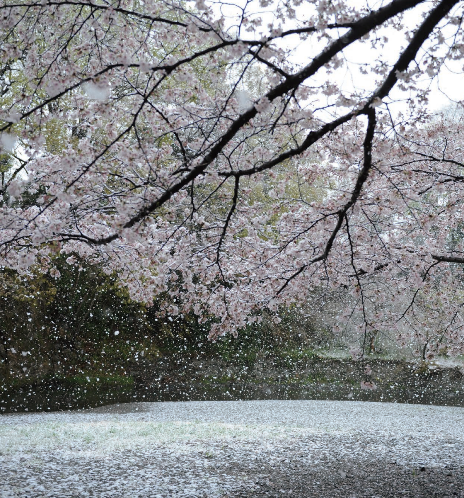
【表紙】 稚魚の放流（関連記事 27P）【裏表紙】 4月に降る雪