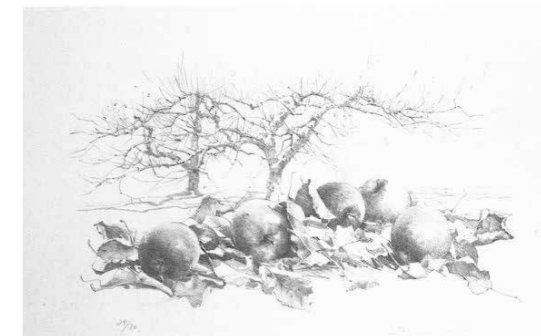
石版画集「林檎のある風景」20葉集より 1981 リトグラフ

ときがわ町文化センターでは、ときがわ町にアトリエを構え、生涯を終えるまでときがわ町で制作活動を続けた洋画壇屈指の画家で、現代リアリズムの巨匠といわれた人気作家である三栖右嗣氏の作品を常設展示しています。中でもリトグラフ20葉集『林檎のある風景』は、三栖右嗣氏の代名詞とも言われる非常に質の高い充実したコレクション群となっています。どうぞごゆっくりご鑑賞ください。