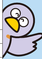
埼玉県マスコット「コバトン」

見舞金請求で組合所定の診断書の原本を提出したときは、1通あたり5千円（その他の様式の原本は3千円）が見舞金に加算されます。（傷害1及び傷害2のみ対象） ※写しに原本証明されたものは対象となりません。