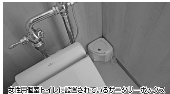
女性用個室トイレに設置されているサニタリーボックス

の必要があると考える。そこで、まず始めに役場庁舎の男性用トイレの一部へ設置する方向で検討し、その他の施設については、利用者の状況や管理上の課題を見極めた上で、設置の必要性の有無について判断していく。 ※サニタリーボックスとは、トイレの個室ごとに設置されている小さなごみ箱のこと。