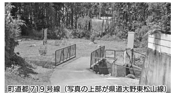
町道都719号線(写真の上部が県道大野東松山線)

は、幅員3m程度の普通車のすれ違いができない生活道路で、瀬戸川から北側は県道大野東松山線の手前で止まっており、隣接する路線の一部は未供用となっている。町内には多くの狭い道路が存在しており、緊急