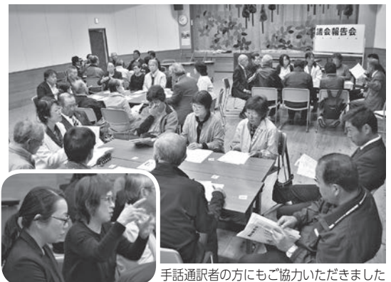
手話通訳者の方にもご協力いただきました