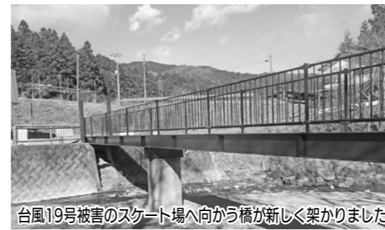
台風19号被害のスケート場へ向かう橋が新しく架かりました

都幾の湯温泉ポンプ交換工事 2475万円 土木費 町道都722・731号線(測量・調査)業務委託(馬場・関堀地内) 1359万円 教育費 明覚小学校プール改築工事 1億4850万円 小・中学校情報機器購入(コンピュータ端末タブレット) 655台 4708万円 感染症対策学習支援員報酬(7名) 203万円 上サ・スケート場災害復旧工事 732万円