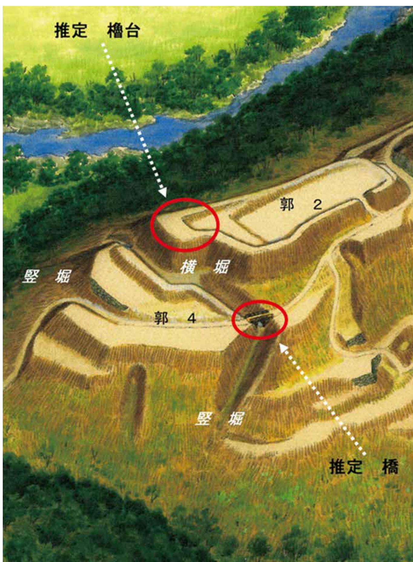
▲ 横矢がかり（推定橋と推定櫓台）

2東端には、平面形が凸状に突出し立面は土壇状となった場所があります。その位置は推定橋に対し横矢かがりの関係にあって、この城の縄張り上の見所となっております。（ときがわ町教育委員会）