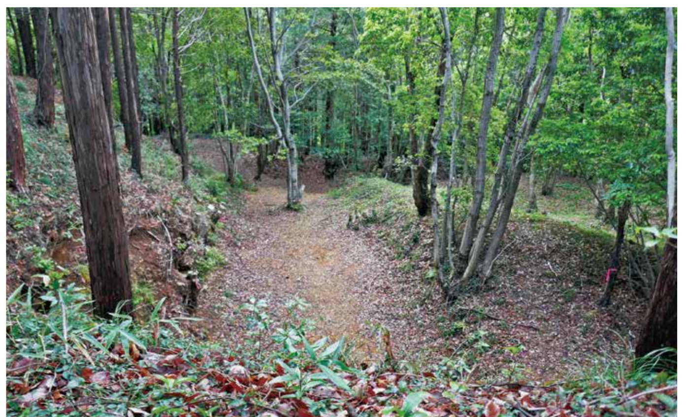
▲ 推定櫓台より（横堀と先端に接続する豎堀）