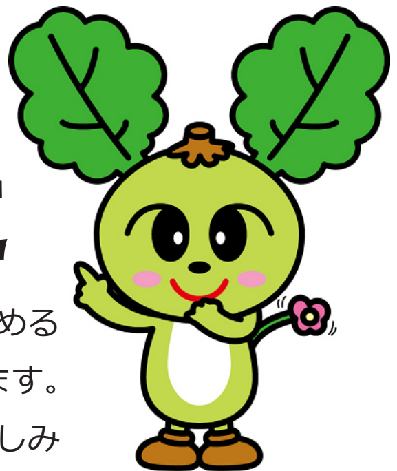
町のマスコットキャラクター のラビたん

川での遊泳やレジャーなど、水辺に涼を求める人が多くなるとともに、水の事故が多発します。基本ルールをしっかりと守って、水遊びを楽しみましょう。