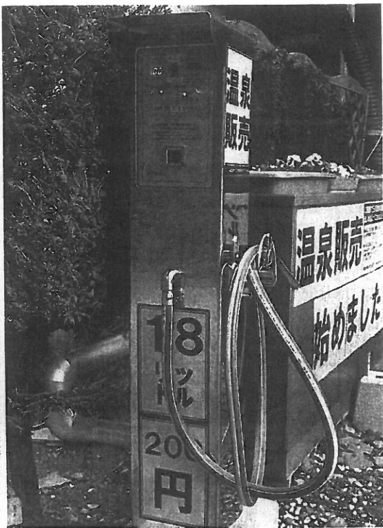
「玉川温泉」の玄関脇に設置された温泉スタンド

同町内の温泉スタンドはアルカリ性ナトリウム塩化物冷鉱泉。2014年50円で、営業時間は午前9時〜午後5時(水)